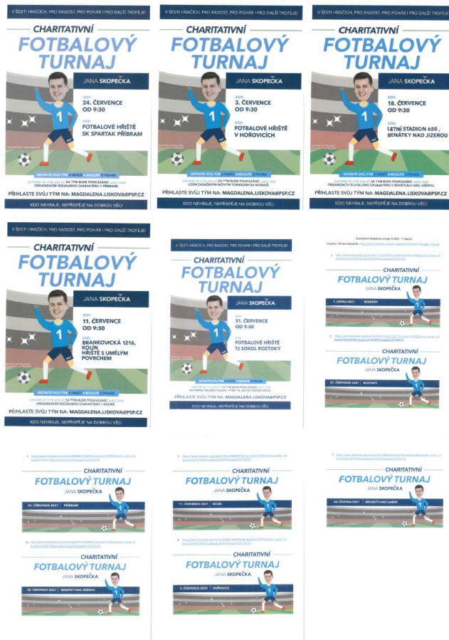
Obrázek č. 4: Plakáty a bannery k akcím