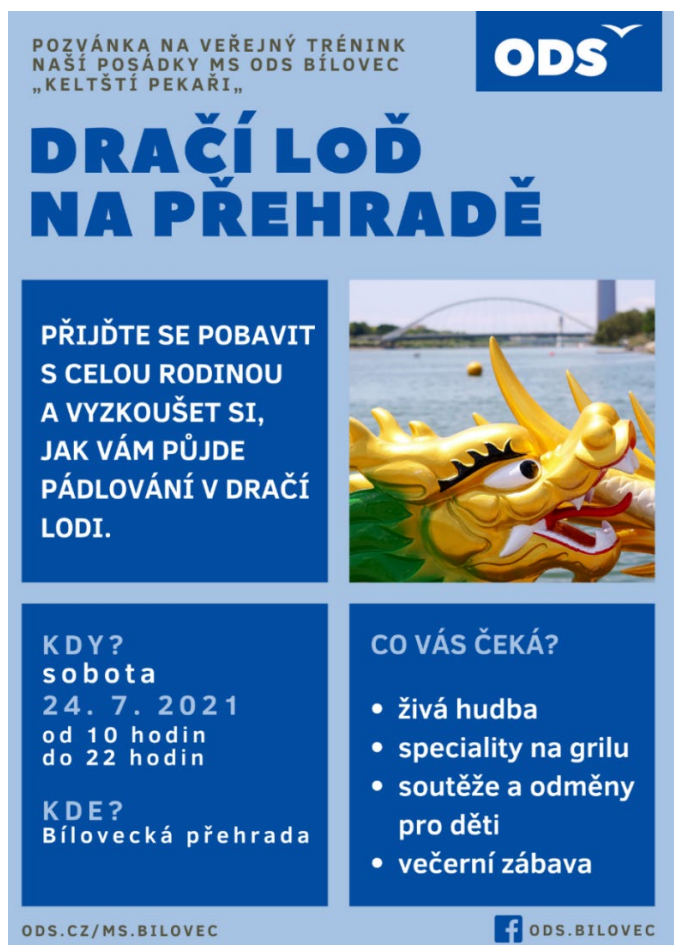
Obrázek č. 10: Pozvánka na akci dračích lodí

Úřad se v tomto smyslu zaměřil na označování propagačních materiálů ve volební kampani. Vzhledem k charakteru akce lze konstatovat, že jde o propagaci volební kampaně kandidujícího subjektu, tj. o prostředek volební kampaně: