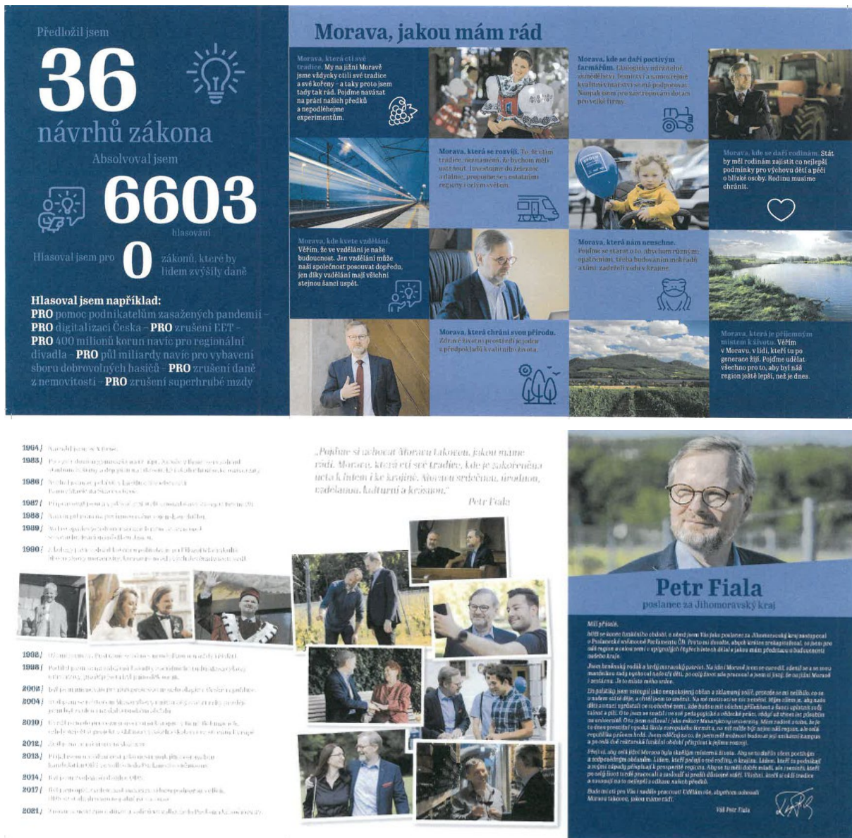
Obrázek č. 1: Leták poslance – varianta 1

V průběhu volební kampaně do PS 2021 byla vytisknuta a distribuována tiskovina tzv. „ leták poslance “. Tento leták se distribuoval v době předmětné volební kampaně, a to ve dvou variantách (mutacích). Obsahem byla propagace předsedy politické strany Petra Fialy (viz obr. č. 1 a 2).