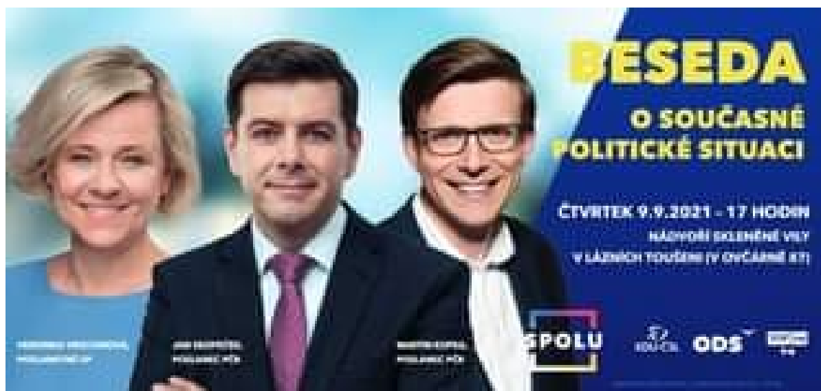
Obrázek č. 9: Pozvánka na besedu

Vzhledem k tomu, že výdaj v celkové výši 1.210,-Kč, kterým došlo k propagaci kandidátů koalice SPOLU, nebyl zahrnutý ve ZoFVK, došlo k porušení § 16d odst. 3 písm. b) volebního zákona.