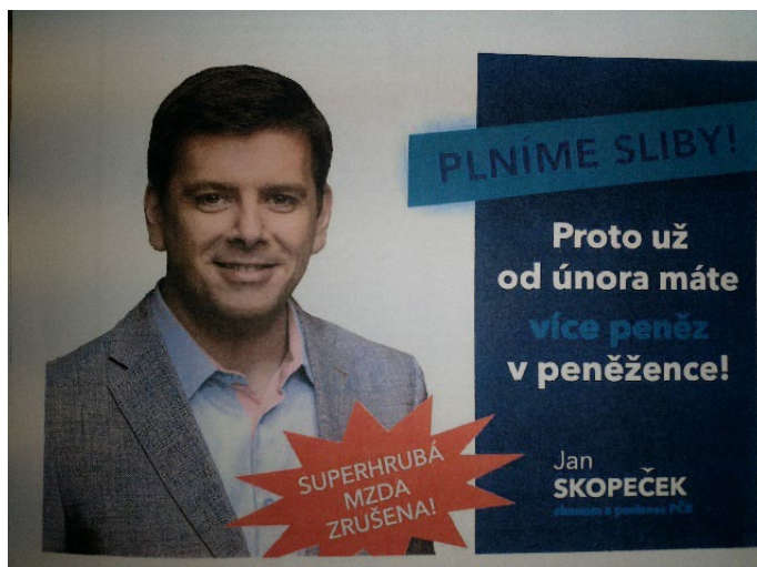
Obrázek č. 7: Plakát „Plníme sliby!“

Úřad dospěl k závěru, že se jedná o zřetelnou a placenou propagaci Jana Skopečka jakožto kandidáta, a že tedy jde o součást volební kampaně politické strany/koalice SPOLU, a to z následujících důvodů: