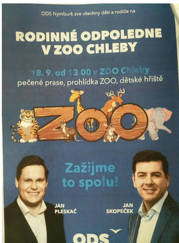
Obrázek č. 8: Pozvánka na akci v ZOO Chleby

Vzhledem k tomu, že výdaje v celkové výši 12.000,24Kč, kterými došlo k propagaci kandidátů koalice SPOLU, nebyly zahrnuty ve ZoFVK, došlo k porušení § 16d odst. 3 písm. b) volebního zákona do Parlamentu ČR.