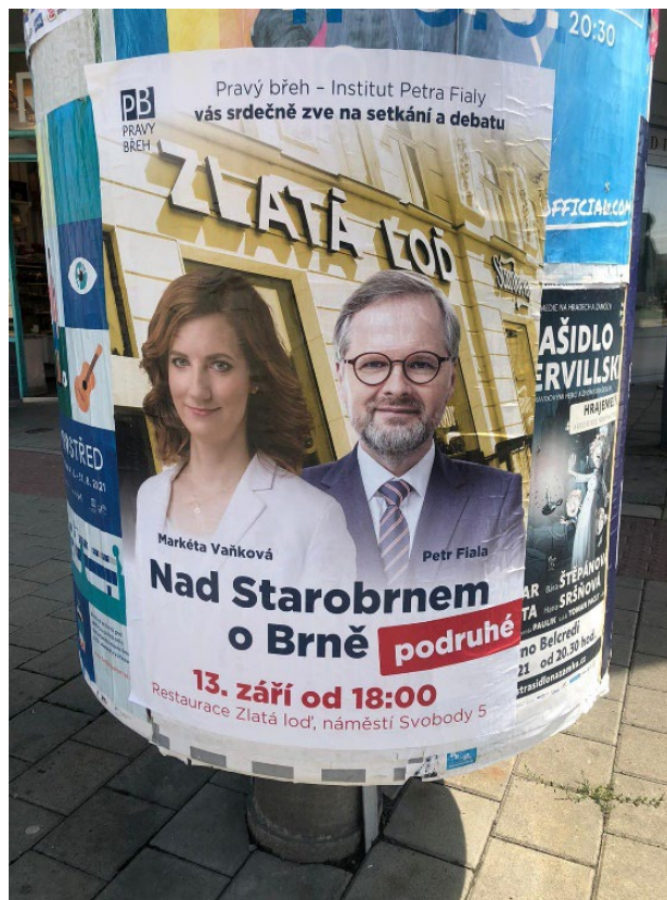
Obrázek č. 15: Venkovní pozvánka na akci „Nad Starobrnem o Brně“

Vzhledem ke skutečnosti, že náklady spojené s oběma akcemi nebyly v účetnictví politické strany identifikovány, a politická strana konstatovala, že tyto akce nevnímá jako součást volební kampaně, dospěl Úřad k závěru, že se jednalo o poskytnutí bezúplatného plnění ze strany organizace Pravý břeh, z.s., neboť v případě účasti předsedy kandidujícího subjektu v obou debatách nešlo o propagaci kandidujícího subjektu bez jeho vědomí. Úřad dále konstatoval, že pozvánky (elektronické i tištěné) na druhou z uvedených akcí nebyly označeny dle požadavků zákona zadavatelem a zpracovatelem.