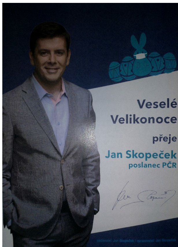
Obrázek č. 6: Inzerát v časopise Nový region

V průběhu kontroly bylo zjištěno, že v tištěném časopise, zaměřeném na lokální zpravodajství ve Středočeském kraji Náš region , který vydává obchodní společnost A 11 s.r.o., IČO 27120805, se sídlem Ortenovo náměstí 1524/36, Praha, bylo publikováno v roce 2021 přání k velikonočním Jana Skopečka, které obsahovalo fotku Jana Skopečka o velikosti 94 x 123 mm s velikonočními motivy a s textem: „ Veselé velikonoce přeje Jan Skopeček poslanec PČR “ a podpis pana Jana Skopečka (viz Obrázek č. 6).