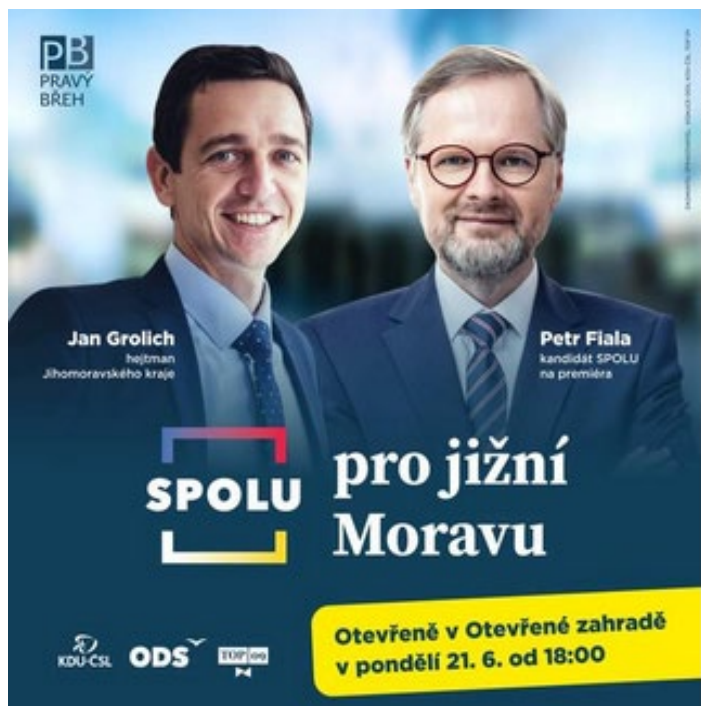
Obrázek 13: Pozvánka na debatu „SPOLU pro jižní Moravu“

Obě setkání byla před svou realizací propagována jak na sociálních sítích (viz Obrázek č. 13 a 14), tak pomocí venkovní reklamy (viz Obrázek č. 15).